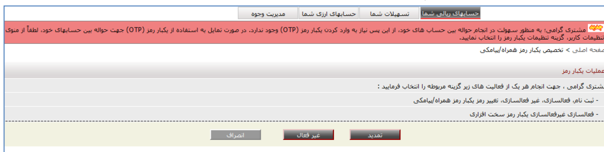
"شکل ۵: انتخاب گزینه تمدید از منوی تخصیص یکبار رمز همراه/ پیامکی"

در ادامه به مراحل استفاده از خدمت یکبار رمز پیامکی در برخی از خدمات پر کاربرد سامانه بانکداری اینترنتی اشاره می‌گردد؛ بدیهی است استفاده از سایر خدمات مطابق با روش معرفی شده می‌باشد: