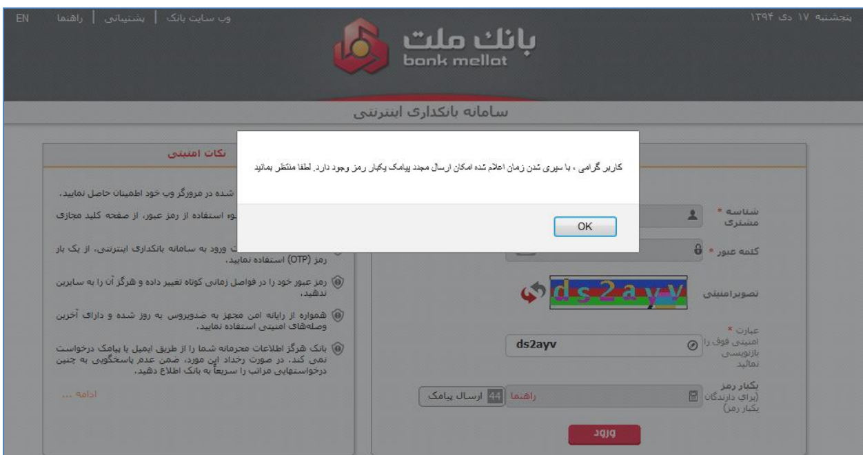
"شکل ۷: پیغام خطا در هنگام درخواست پیامک یکبار رمز قبل از زمان یک دقیقه در هنگام ورود به سامانه بانکداری اینترنتی"