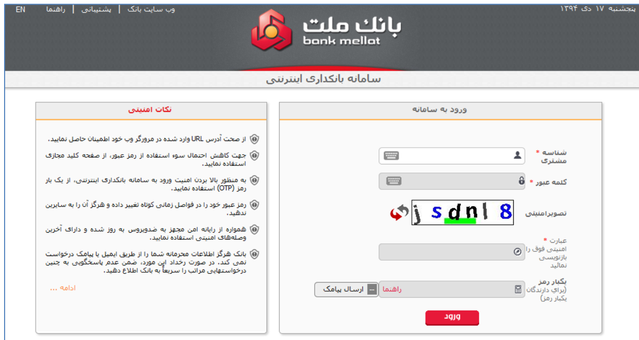
"شکل ۶: صفحه Login سایت بانکداری اینترنتی پس از معرفی خدمت یکبار رمز پیامکی"