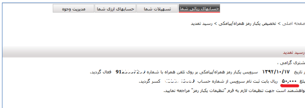
"شکل ۴: رسید ثبت نام خدمت تخصیص یکبار رمز همراه/ پیامکی"