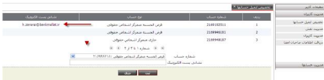
(تصویر 5-3 تخصیص ایمیل به حسابها)

پس از آن سایر کاربران در هنگام دریافت فایل صورتحساب و با انتخاب گزینه ارسال به ایمیل، گزارش مربوطه به آدرسی ایمیلی که در فرم بالا تخصیص داده شده، ارسال خواهد شد.